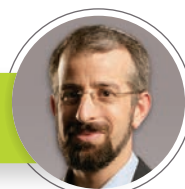
פרופ' קליימן רון מרצה בכיר לדיני נזיקין ומשפט עברי

בבחינה בעל פה נשאלתי כמה שאלות, וביניהן שאלה אחת שלא זכרתי את התשובה המדויקת עליה. השבתי לשלושת הבוחנים, שאיני זוכר את התשובה המדויקת אבל הייתי מחפש את התשובה לשאלה שהם שאלו בחוק המקרקעין. ברוך ה', זה הספיק לי כדי לעבור את הבחינה. הלקח – לא תמיד אתם צריכים לזכור בדיוק את הסעיף בעל פה, חשוב יותר לדעת היכן לחפש אותו! בהצלחה רבה לכולם בהתמחות וגם בבחינות הלשכה.